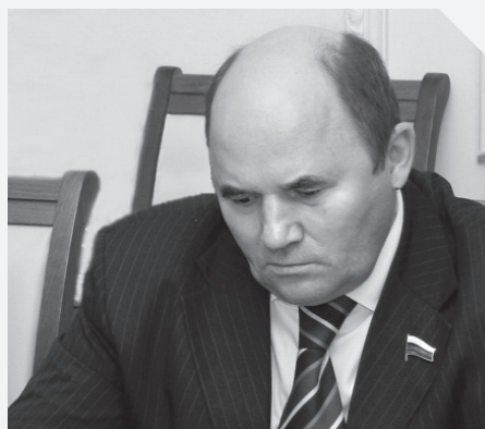
Георгий Леонтьев, депутат Государственной Думы России

акцентировал внимание на том, что данный процесс, по сути, носит перманентный характер. По его мнению, законченного списка полномочий добиться нельзя — «невозможно универсум деятельности описать в разграничении,